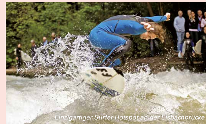
Einzigartiger Surfer-Hotspot an der Eisbachbrücke

Danach geht es die Platzgasse entlang, bis diese links in die Pfisterstraße mündet. Noch bis zur Sparkassenstraße muss das Rad geschoben werden, dann radelt man die Straße weiter geradeaus und biegt dann links zum 16 Alten Hof ab. Man durchquert den Hof der ehemaligen Residenz und fährt am anderen Ende in die Burgstraße ein. Sie stößt direkt auf den Marienplatz und man kehrt an den Ausgangspunkt der Tour zurück.