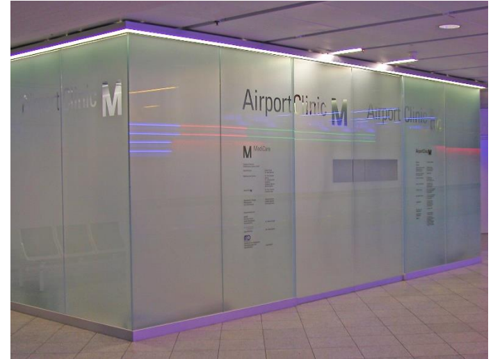
/Terminal 1 Ebene 03