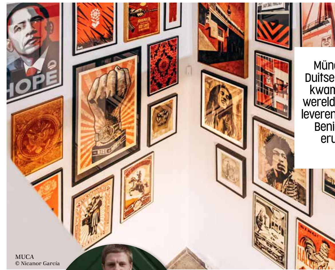
MUCA © Nicanor Garcia