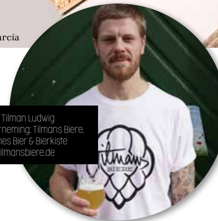
Local: Tilman Ludwig Onderneming: Tilmans Biere, Frisches Bier & Bierkiste Info: Tilmansbiere.de

München was de pionier binnen de Duitse graffiti-scene. In de jaren tachtig kwamen kunstenaars vanuit de hele wereld naar de stad om hun bijdrage te leveren aan de vernieuwende street art. Benieuwd hoe dat vandaag de dag eruitziet? Zet dan koers naar de Tumblingerstraße