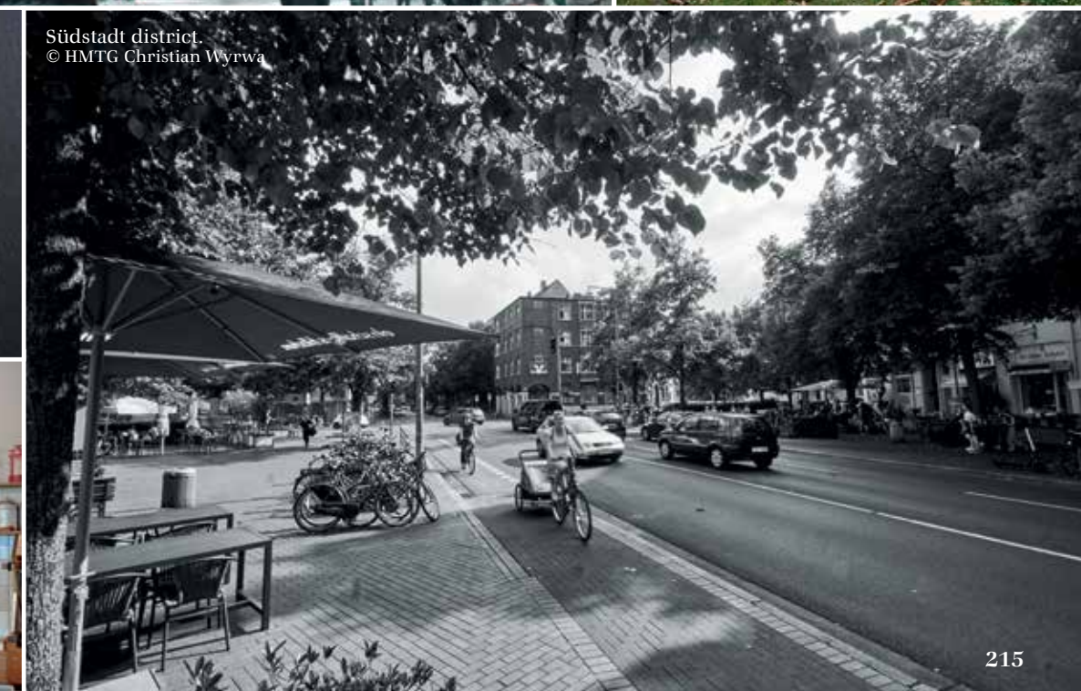
Südstadt district.