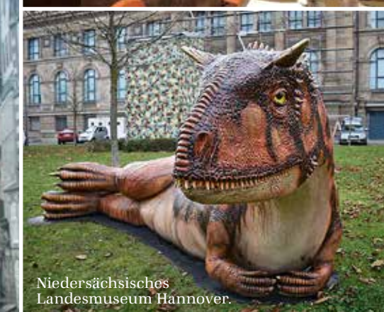
Niedersächsisches Landesmuseum Hannover.