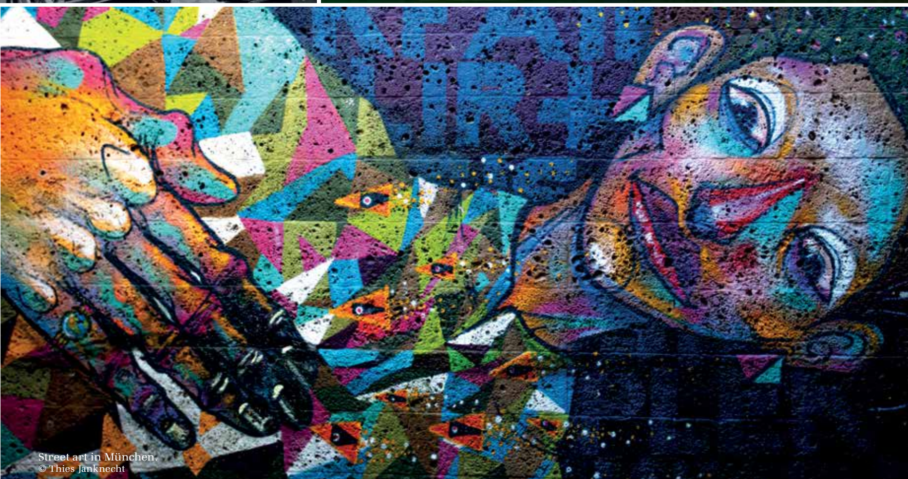
Street art in München.