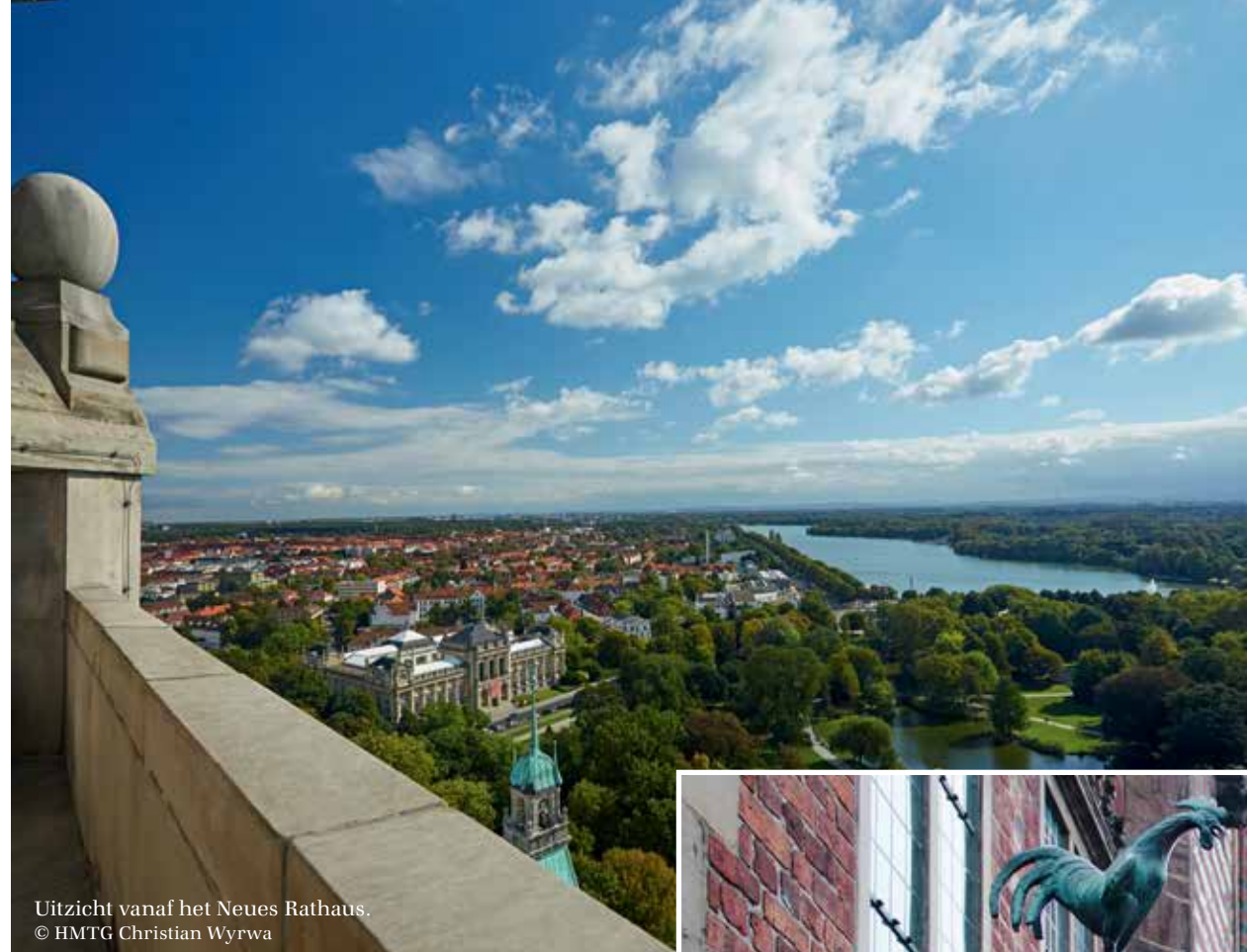
Uitzicht vanaf het Neues Rathaus.