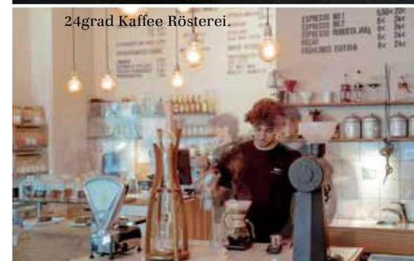
24grad Kaffee Rösterei.