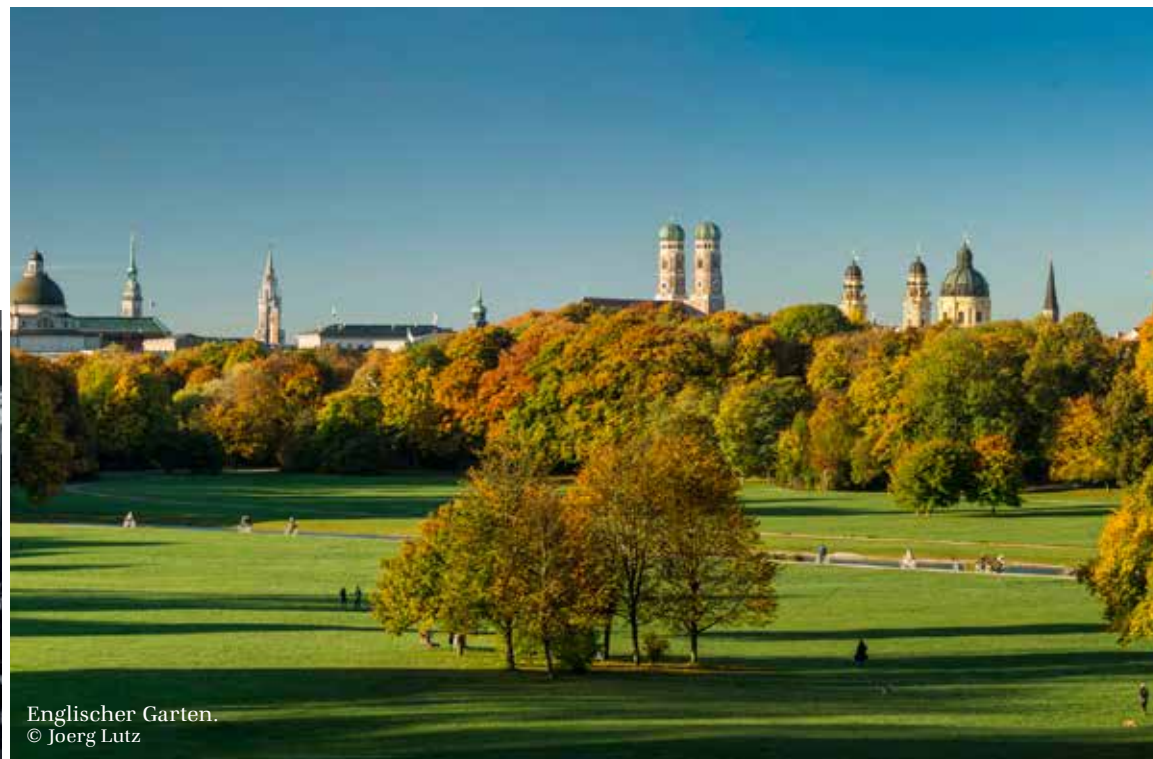
Englischer Garten.