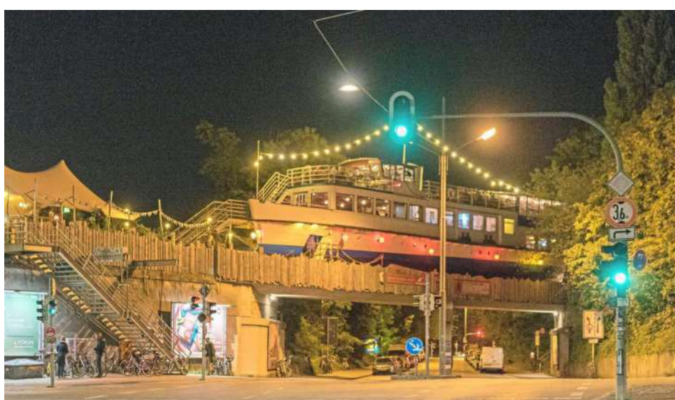
Der Ausflugsdampfer „Alte Utting“ liegt jetzt auf einer stillgelegten Eisenbahnbrücke und dient als Gaststätte.

Die Recherche wurde von München Tourismus und Uschi Liebl PR unterstützt. Über Art und Inhalt des Artikels entscheidet allein die Redaktion.