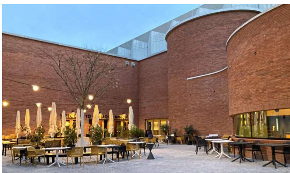
Das 2021 eröffnete Volkstheater fügt sich mit seinem roten Backsteinkleid in die Umgebung des Schlachthofviertels ein.