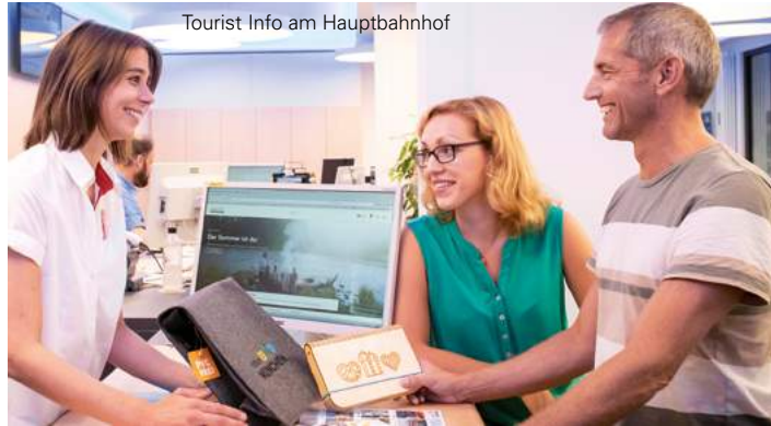
Tourist Info am Hauptbahnhof

München Tourismus bietet Ihnen Information und Inspiration rund um Ihren Besuch in München.