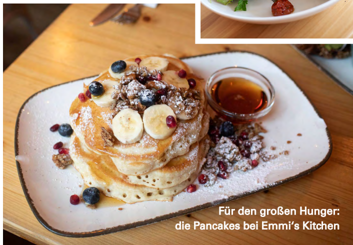
Für den großen Hunger: die Pancakes bei Emmi's Kitchen