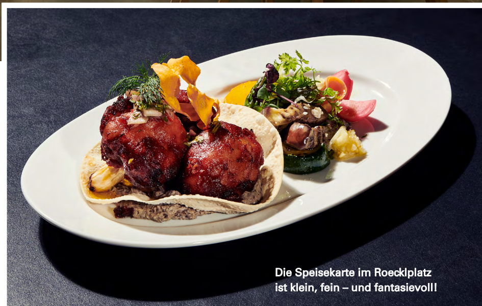
Die Speisekarte im Roecklplatz ist klein, fein – und fantasievoll!