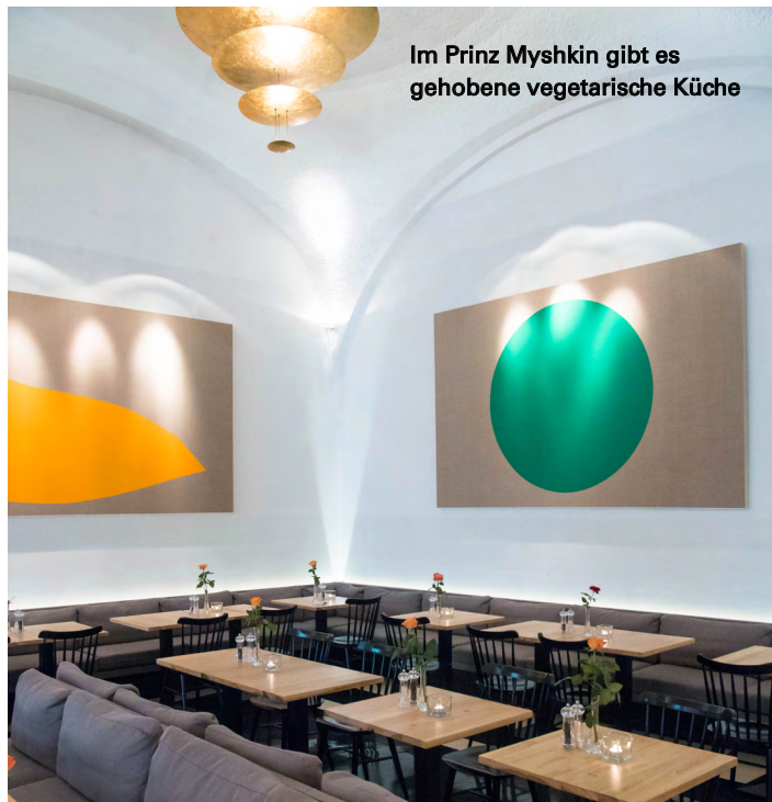
Im Prinz Myshkin gibt es gehobene vegetarische Küche