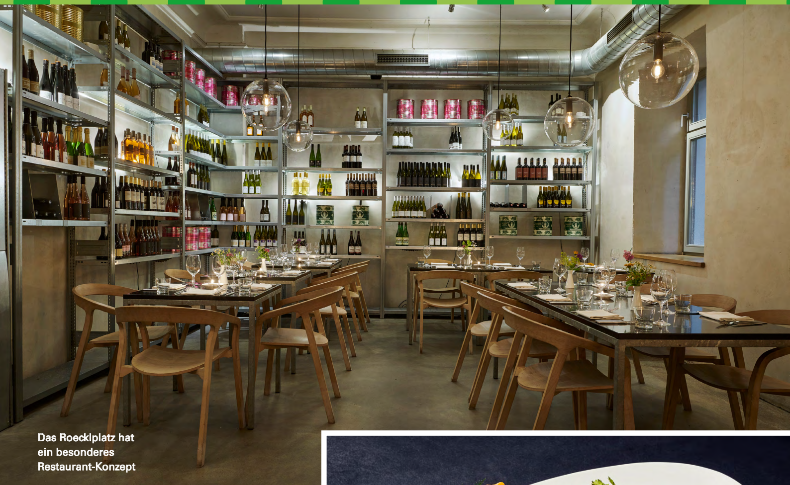
Das Roecklplatz hat ein besonderes Restaurant-Konzept