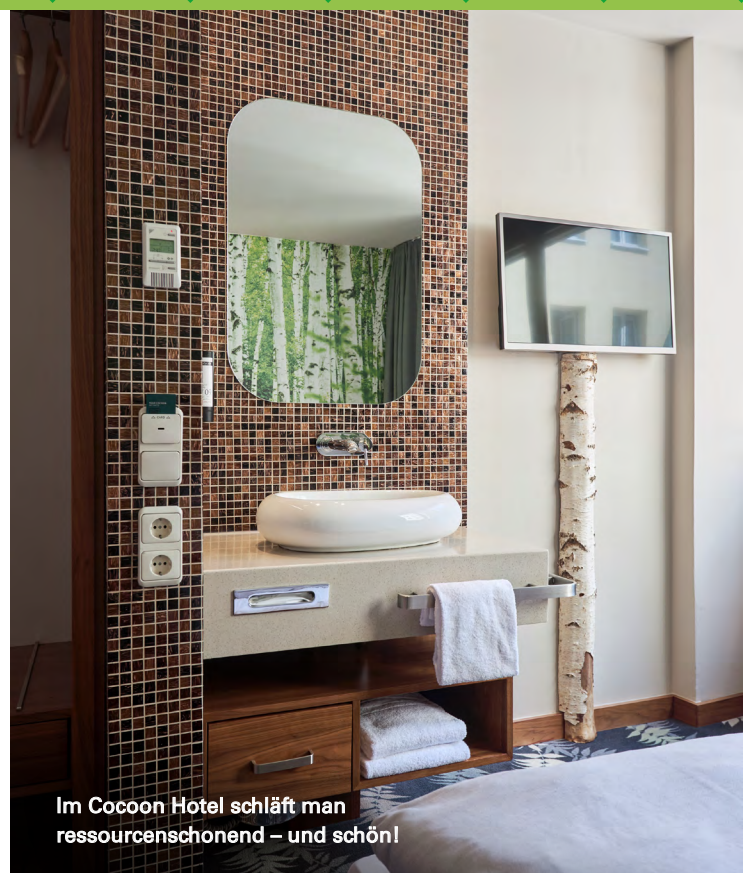
Im Cocoon Hotel schläft man ressourcenschonend – und schön!